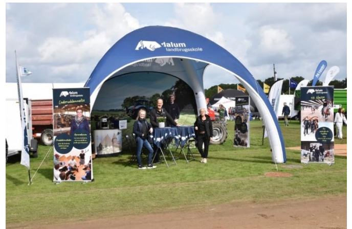
Dalum på Det Fynske Dyrskue