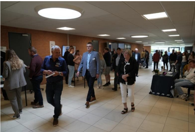
Rundvisning i Odense