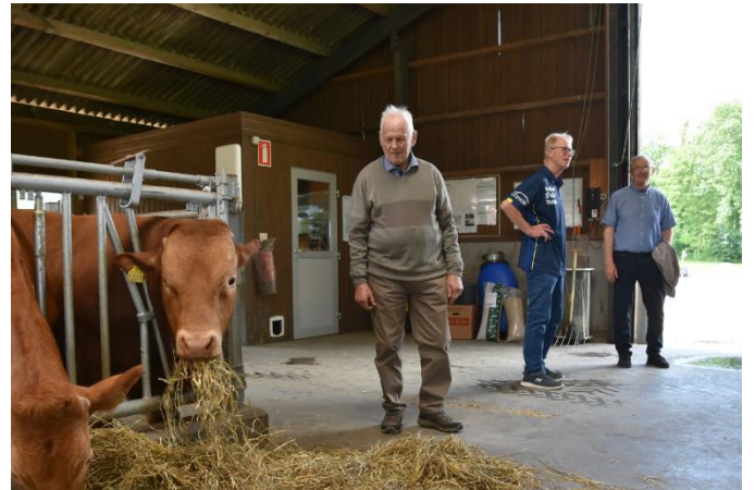
Besøg i kostalden på Korinth