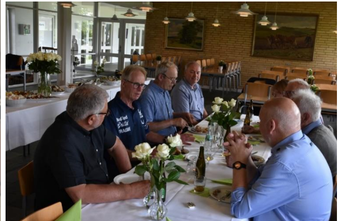
Festmiddag på Korinth