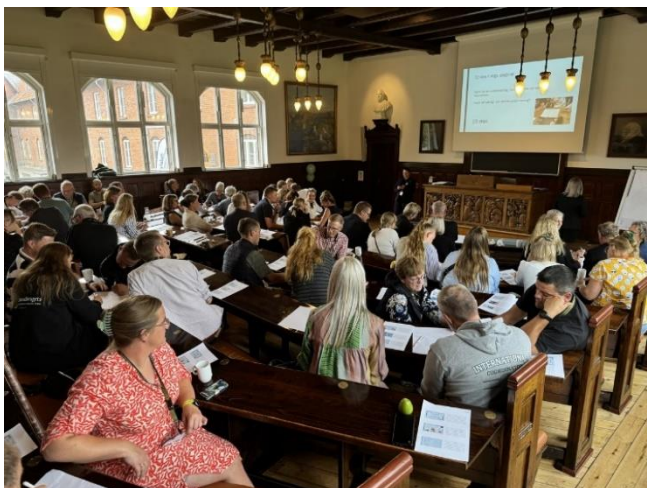
Årsmøde for jordbrugsskolerne

Billeder fra året, der gik på Dalum Landbrugsskole: