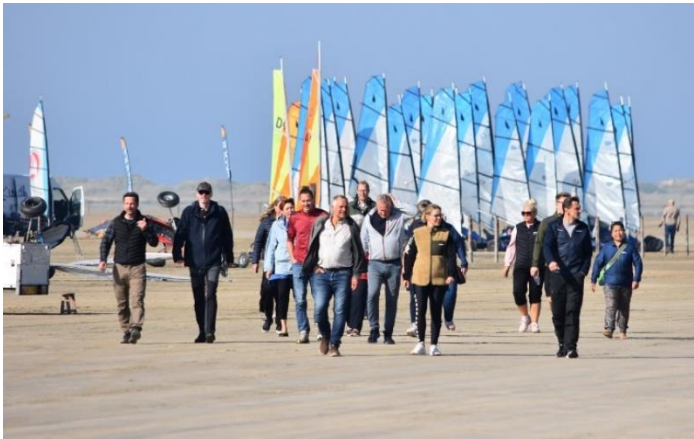
Personaletur til Rømø