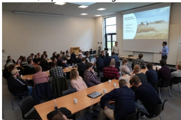
Agrarøkonomer til konference