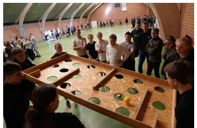
Eleverne holder Store Legedag