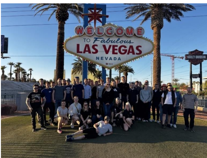
2. hovedforløb på studietur til USA