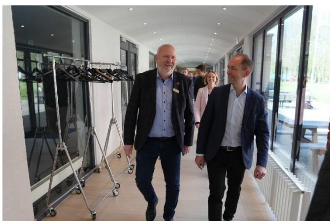
Skatteminister på besøg