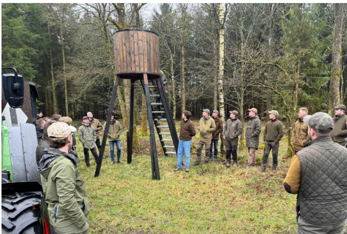
Herregårdsjægere besøger Tjele Gods