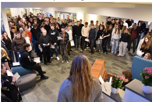
Morgensamling på afd. Korinth