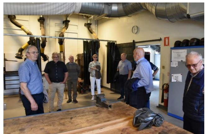
Rundvisning på Korinth