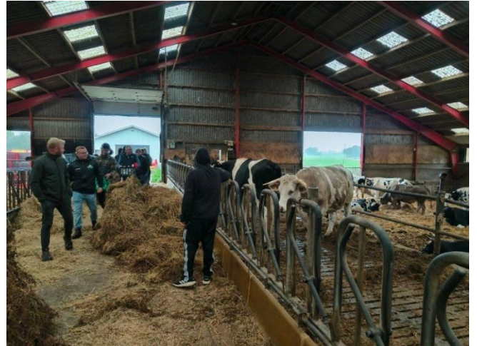
1. hovedforløb på økologitur