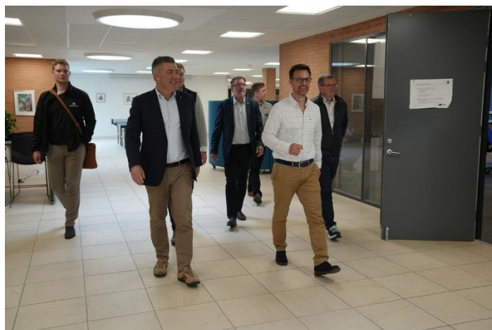
Klimaminister på besøg