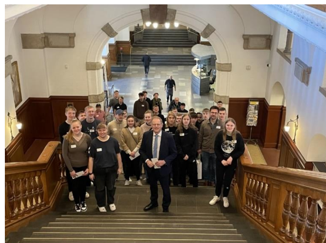
2. hovedforløb på samfunds-fagstur