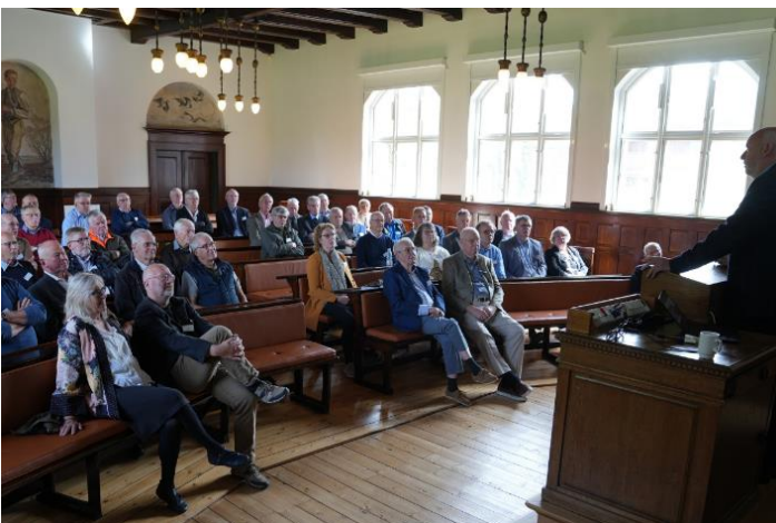
Orientering i Høresalen i Odense