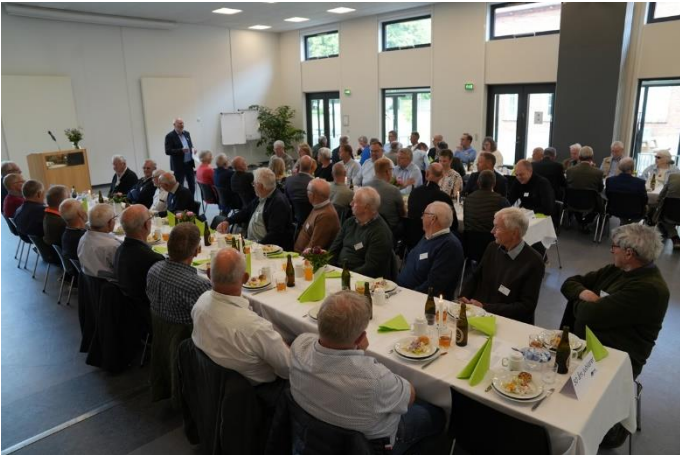
Festmiddag i Odense